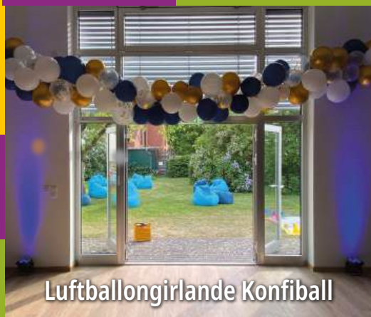
Luftballongirlande Konfi Ball