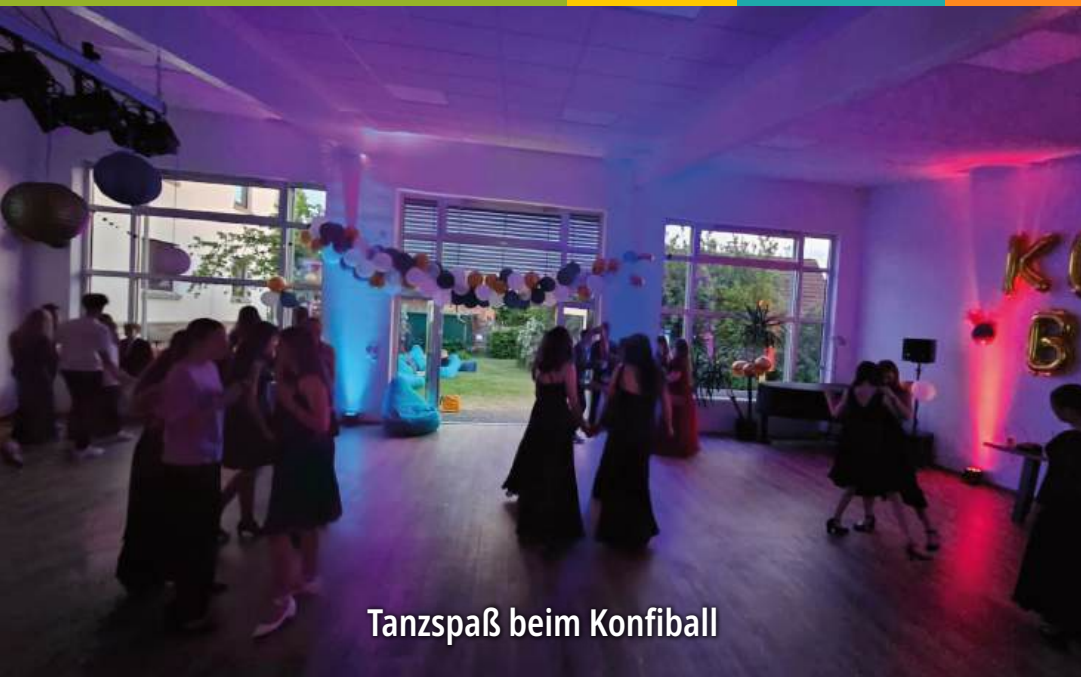
Tanzspaß beim Konfi Ball