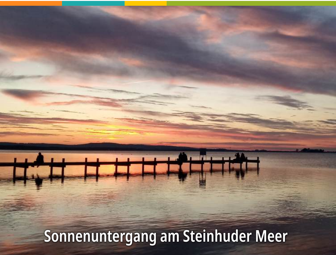
Sonnenuntergang am Steinhuder Meer

„Jesus Christus spricht: „Ich bin das Licht der Welt“ (Joh 8,12)