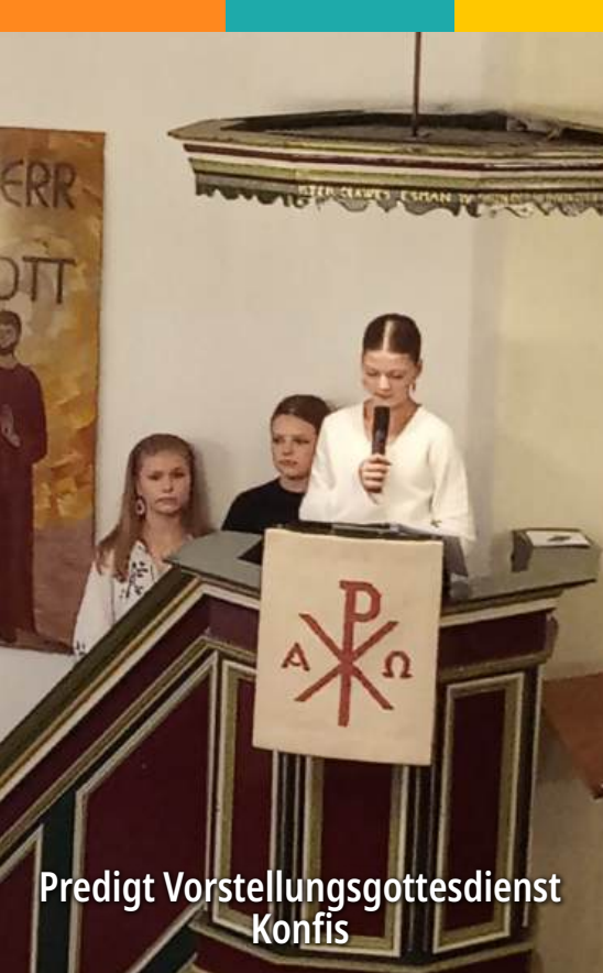
Predigt Vorstellungsgottesdienst Konfis