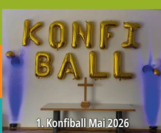
1. Konfi Ball Mai 2026